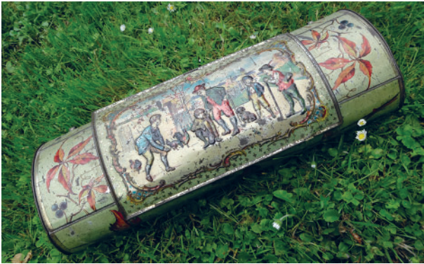
Boîte de récolte.

Appelée boîte à botanique ou boîte d'herborisation, vasculum, ou encore Botanisiertrommel en allemand, la boîte en fer-blanc verte ou noire a accompagné des générations de botanistes et de chasseurs de plantes pendant plus de deux siècles. Elle a accueilli des myriades de spécimens qui font encore aujourd'hui la fierté de nos grands herbiers.