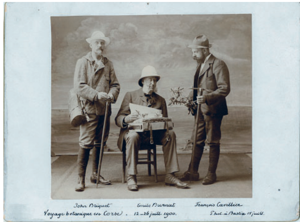
John Briquet, Emile Burnat et François Cavillier Archives; © Conservatoire et Jardin botaniques de Genève.

Archives; © Conservatoire et Jardin botaniques de Genève.