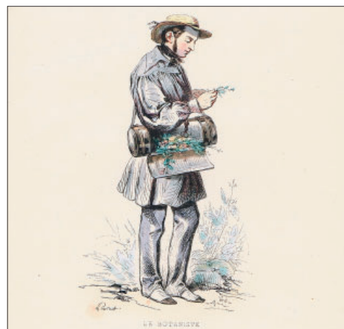
Le botaniste tiré des Français peints par eux-mêmes. domaine public.

Tombée en désuétude après la Seconde Guerre mondiale, la boîte en fer-blanc est remplacée par des sachets ou des boîtes en plastique, ou par la presse à hercier qui la concurrençait de longue date. Devenu vintage, le vasculum est aujourd'hui une source d'inspiration pour des artistes et un objet prisé des collectionneurs.